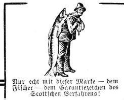
Nur echt mit dieser Marke — dem Fischer — dem Garantieschild des Scottischen Verfahrens!

Käuflich in \frac{1}{4} und \frac{1}{2} Flaschen zu Fr. 5.— und Fr. 2.50.