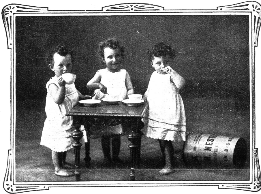
VEVEY, 10. Juli 1909.

Ich sende Ihnen unter aufrichtigster Dankesbezeugung die Photographie meiner Drillingsknaben, welche durch Nestlé's Kindermehl gerettet wurden.