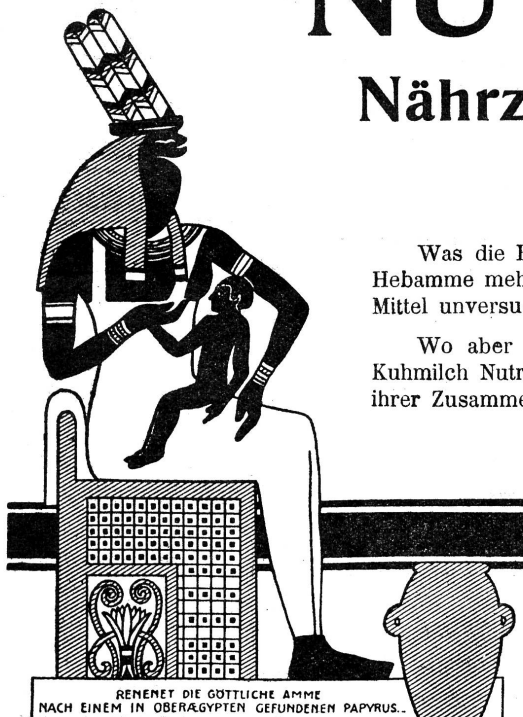
RENET DIE GÖTTLICHE AMME NACH EINEM IN OBERÄGYPTEN GEFUNDENEM PAPYRUS.