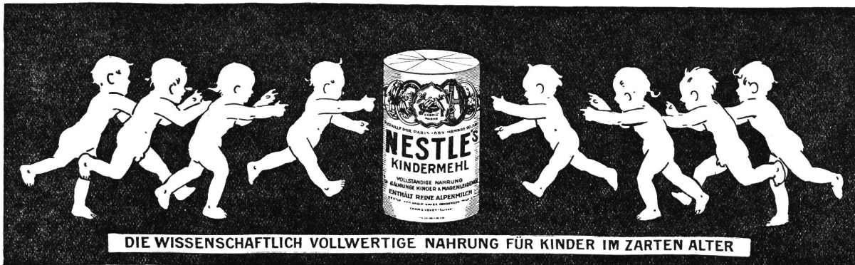
DIE WISSENSCHAFTLICH VOLLWERTIGE NAHRUNG FÜR KINDER IM ZARTEN ALTER

Generalvertreter für die Schweiz: H. Ruckstuhl, Zürich VI, Scheuchzerstrasse 112.