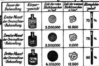
Einfluss der Ovomaltine-Behandlung auf Körpergewicht und Blut.