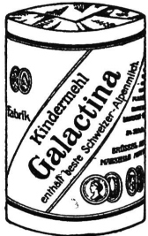
Büchse Fr. 2.—

Ob Sie sich nun für den Haferfischleim (eigenes Herstellungsverfahren, kein geröstetes Mehl!) entschließen, oder zum Milchmehl (je nach Ansicht und Meinung von Arzt oder Hebamme) greifen, tut nichts zur Sache: Jedem dieser beiden „Galactina“-Kindernährmittel sind in der richtigen Form und im richtigen Mengenverhältnis die nötigen Phosphate und Nährsalze beigegeben. Beide Sorten erzeugen gesundes Blut, bewirken einen kräftigen Knochenbau, stärken die Muskeln und bilden auch die Baustoffe für gesunde Zähne, Nägel usw. — Ist einerseits der Haferfischleim dank dem Spezialverfahren absolut vollwertig im Gehalt, so enthält andererseits das Milchmehl über 50 Prozent reine Alpenmilch, was kein zweites Produkt aufweisen kann.