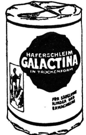
Büchse Fr. 1.50

Noch einige im April 1927 unverlangt eingelaufene Dankschreiben in Anerkennung der vorzüglichen Qualität der „Galactina“: