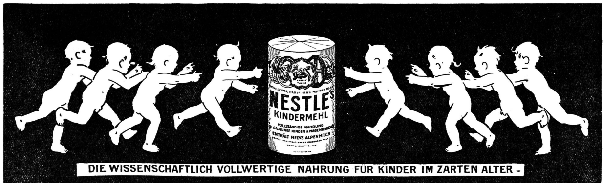
DIE WISSENSCHAFTLICH VOLLWERTIGE NÄHRUNG FÜR KINDER IM ZARTEN ALTER -

Fabrik pharmaceutischer Präparate KARL ENGELHARD, Frankfurt a. M.