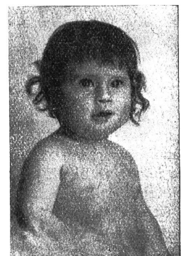
Das gleiche Kind genau 4 Monate später