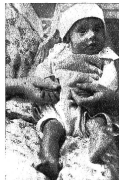
Rachitisches Kind genau 6 Monate alt