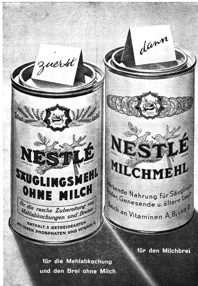
für die Mehlabkochung und den Brei ohne Milch