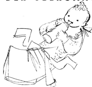
... VOM DER HAUPTSÄCHLICHST AUS MILCH BESTEHENDEN NAHRUNG DES ERSTEN ALTERS