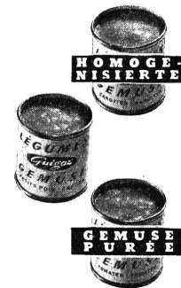
... AUF DIE ABWECHSLUNGSREICHERE NAHRUNG DES ZWEITEN ALTERS ERFOLGT LEICHTER MIT DEM