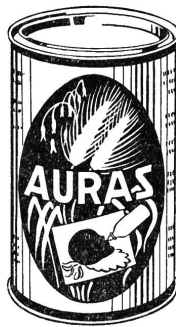
K 406 B

Albert Meile AG. Bellerivestraße 53 Zürich 34