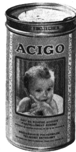
Acigo teilweise entrahmt (grüne Etikette)

Die angesäuerte Milch Acigo der Firma Guigoz besitzt neben den oben angeführten Vorteilen der Ansäuerung alle Charakteristika und Qualitäten der besten Guigoz-Milch. Ferner ist sie zur Prophylaxe der Kinder-Anaemie und Rachitis mit Eisen und Vitamin D angerichtet. Das Acigo wird deshalb in gegebenen Fällen von größter Nützlichkeit sein, besonders zur Verhütung der Rachitis und wie die Guigoz-Milch gleichzeitig vollkommenes Wachstum wie erhöhte Widerstandsfähigkeit gegenüber Infektionen gewährleisten.