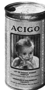
Acigo vollfett (rote Etikette)