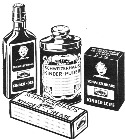
Dr. Gubser-Knoch AG. Schweizerhaus, Glarus zuverlässige Heil- und Vorbeugungsmittel für die Pflege des Säuglings und des Klein- kinds. Tausendfach erprobt und bewährt.

tin zu ersetzen, und wir alle wissen, daß sie seit ihrer Wahl zur Präsidentin, die an der Generalversammlung 1953 erfolgte, für unsere Sektion, in Verbindung mit Frau von Gunten, Großes geleistet hat, das seit Neujahr 1957 einen jeden Kollegen unseres Kantons zugute kommt.