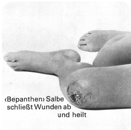
«Bepanthen» Salbe schließt Wunden ab und heilt