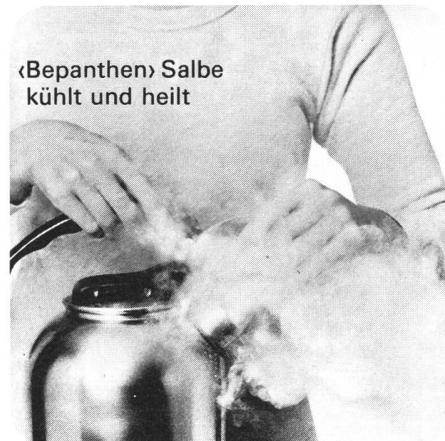
«Bepanthen» Salbe kühlt und heilt