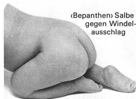
«Bepanthen» Salbe gegen Windel- ausschlag