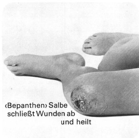
«Bepanthen» Salbe schließt Wunden ab und heilt