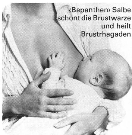
«Bepanthen» Salbe schont die Brustwarze und heilt Brusthagaden