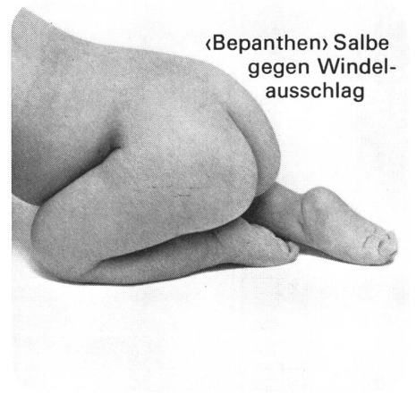
«Bepanthen» Salbe gegen Windel- ausschlag