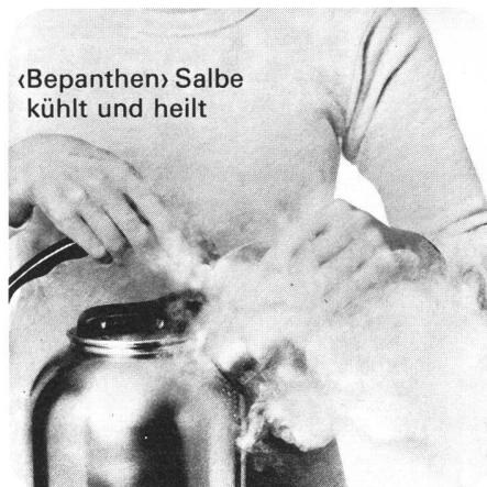
«Bepanthen» Salbe kühlt und heilt