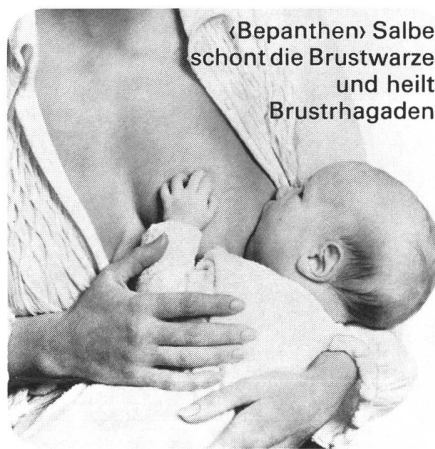
«Bepanthen» Salbe schont die Brustwarze und heilt Brusthagaden