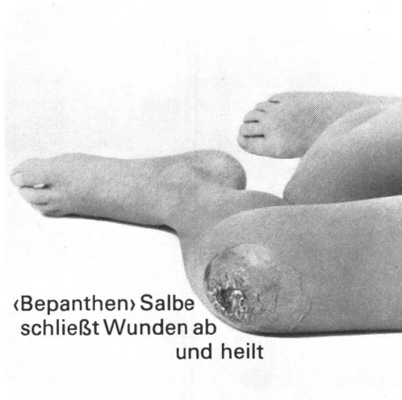
«Bepanthen» Salbe schließt Wunden ab und heilt