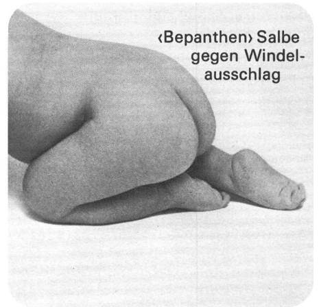
«Bepanthen» Salbe gegen Windel- ausschlag