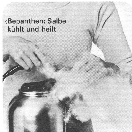
«Bepanthen» Salbe kühlt und heilt