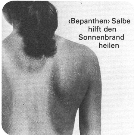
«Bepanthen» Salbe hilft den Sonnenbrand heilen