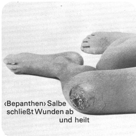
«Bepanthen» Salbe schließt Wunden ab und heilt