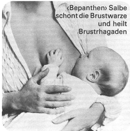
«Bepanthen» Salbe schont die Brustwarze und heilt Brusthagaden