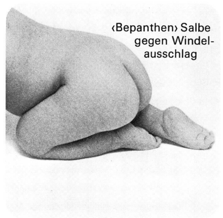
«Bepanthen» Salbe gegen Windel- ausschlag