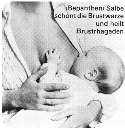
«Bepanthen» Salbe schont die Brustwarze und heilt Brustthgaden