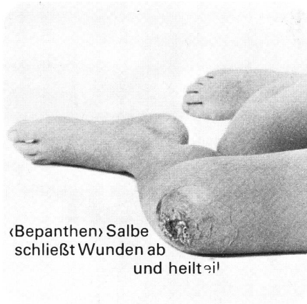
«Bepanthen» Salbe schließt Wunden ab und heilt eil