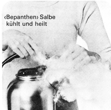
«Bepanthen» Salbe kühlt und heilt