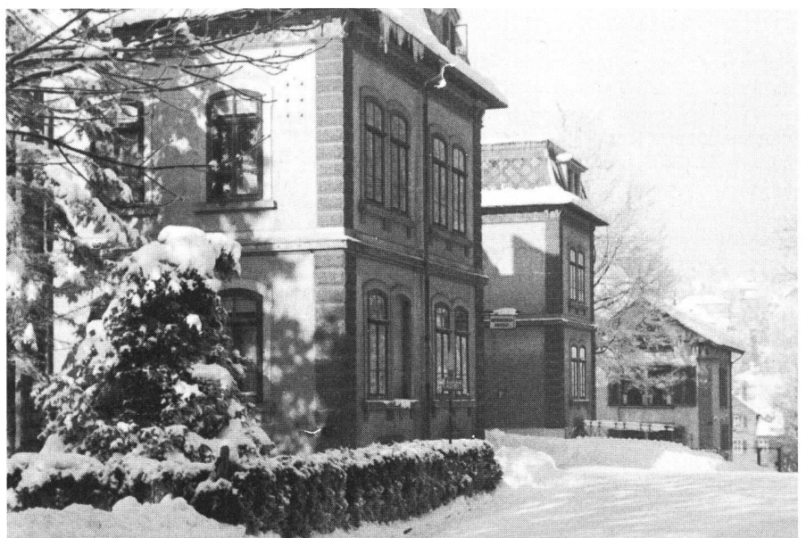
Die alte Entbindungs-Anstalt. Für viele St.Galler Kolleginnen noch ein Begriff

1. Änderung des Titels «Schweizerischer Hebammenverein» in «Schweizerischer Hebammenverband» mit folgen-