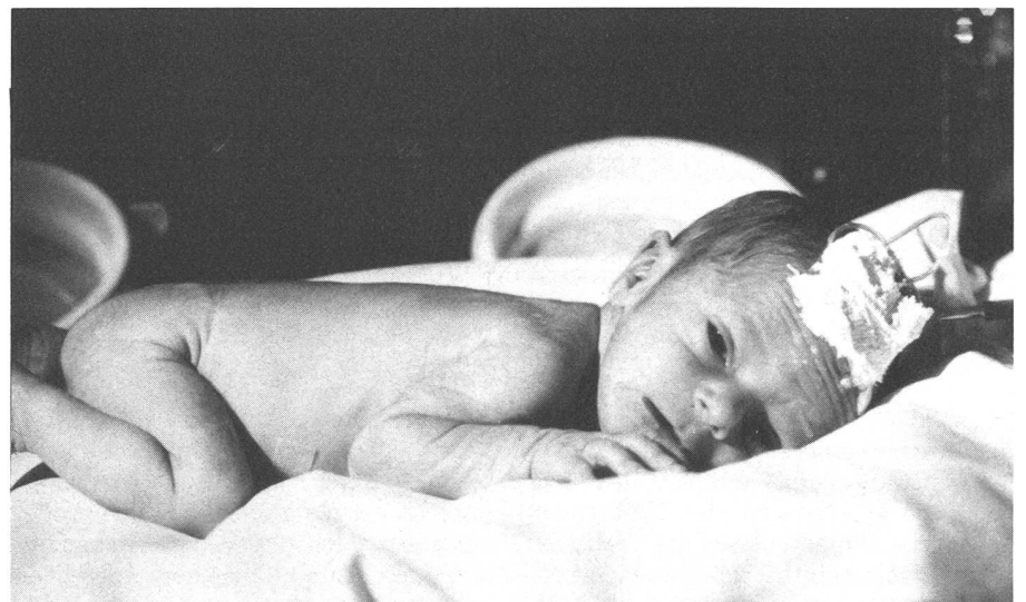
Terminmangelgeburt: sorgenvoller, älthcher Gesichtsausdruck.