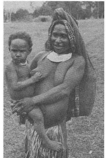
Mutter mit Kind in Papua-Neuguinea.

Die Weiterbildungsmöglichkeiten in der welschen Schweiz folgen in der französischen Übersetzung.