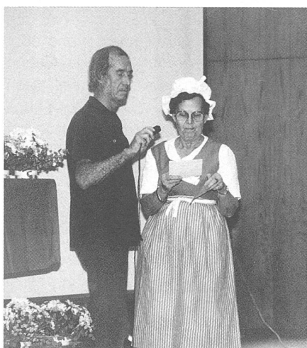
Hebamme im Tracht

360 Teilnehmerinnen nahmen an der Weiterbildung und 180 Teilnehmerinnen an den Workshops teil. Die Gastgeber-Sektion Vaud hatte zahlreiche interessante,