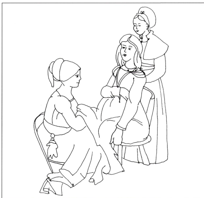
... e seduta, sostenuta e accompagnata da altre donne. Ogni cultura ha il suo metodo de partorire.

Le donne in Svizzera, come in tutta Europa, si organizzano e si uniscono in gruppi professionali e cercano di eliminare i rischi del loro mestiere. Il dibattito sulla riforma professionale si avvia in tutti i paesi europei. L'Associazione Svizzera delle levatrici nasce nel 1894 a Zuri-