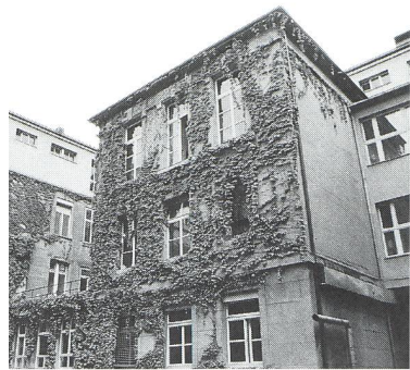
Bern: Integration des kantonalen Frauenspitals ins Inselspital