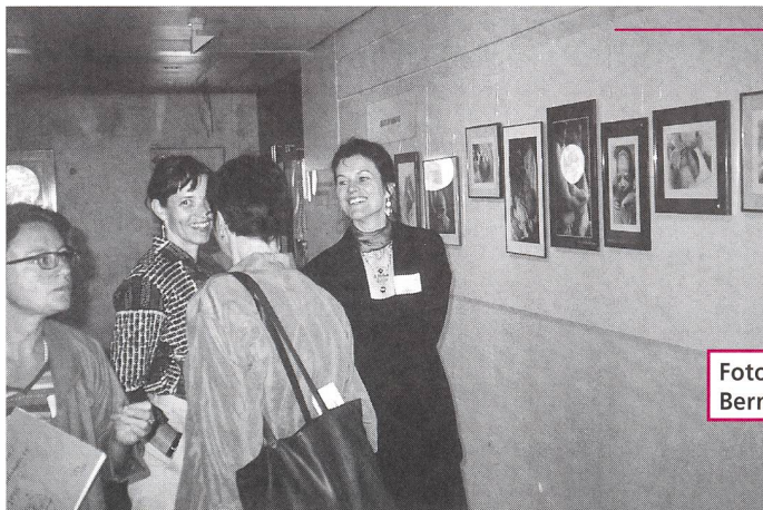
Fotoausstellung von Bernard Landon

tigkeit, Berufspflichten und Bewilligungen für die Ausübung des Hebammenberufes regeln. In der Mehrheit der Kantone ist die Hebamme nicht Medizinalperson wie die Ärzte, Zahnärzte, Tierärzte und Apotheker, sondern ihr Beruf wird unter «anderen Berufen des Gesundheitswesens» oder «medizinischen Hilfsberufen angeführt, zusammen mit Krankenschwestern, Chiropraktikern, PhysiotherapeutInnen und anderen. Der Unterschied zwischen Medizinalpersonen und anderen Berufspersonen des Gesundheits-