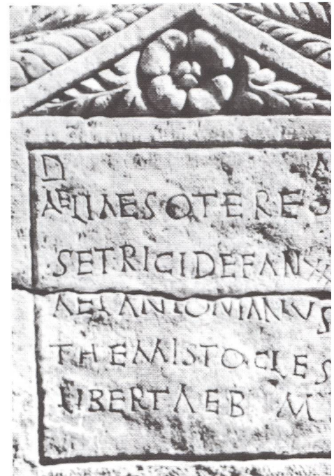
Pierre tombale de Aélia Sotéra, sage-femme. L'inscription dit: «Aux dieux mânes de Aélia Sotéra, sage-femme, morte à l'âge de 35 ans. Aélius Antonianus Thémistoclés à son affranchie qui l'a bien mérité». Ces inscriptions funéraires sont une source importante pour les historiens (Musée de Split).

siège doit être capable d'accueillir des femmes même assez charnues; sa hauteur sera moyenne: aux femmes petites, on met un tabouret sous les pieds pour compenser la taille de leurs membres. Les flancs du fauteuil, au-dessous du siège, doivent être entièrement garnis de planches, tandis que le devant et le dos doivent rester ouverts, pour l'usage obstétrical qu'on va décrire. Dans la partie supérieure, au-dessus du siège et sur les côtés, il y aura deux bras formant un \Pi grâce à une entretoise, afin que les mains puissent prendre appui sur eux au cours des efforts. Derrière, il y aura un dossier incliné de façon telle que les reins et les hanches y trouvent une résistance aux mouvements de retrait.» (Gynécologie II, 3)