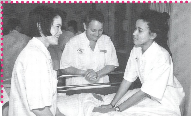
Les photos de ce numéro ont été prises dans les écoles de sages-femmes de Berne et de Lucerne.

qualité et de l'efficacité de la pratique professionnelle.