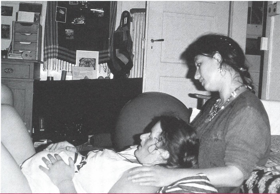
Grosse Bedeutung der Hausgeburt: In Holland kommen über 30 Prozent der Kinder daheim zur Welt.

und vergrössert die Chance, dass Schwangerschaft, Geburt und Wochenbett zu einem positiven Ereignis werden.