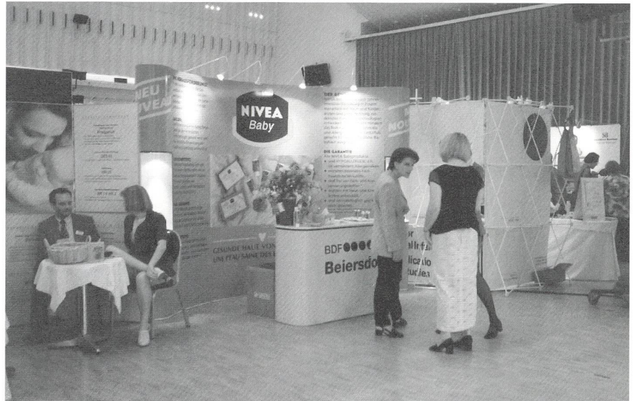
La visite des stands est toujours enrichissante.

J'ignore pourquoi dans la pratique quotidienne quelques sages-femmes sont si réticentes à partager leur expérience. Peut-être ceci est-il à mettre en relation avec la concurrence, le surcroît de travail, le manque d'intérêt à conseiller des élèves sages-femmes? Il appartient à chacune d'analyser sa retenue ou les raisons de cette retenue.