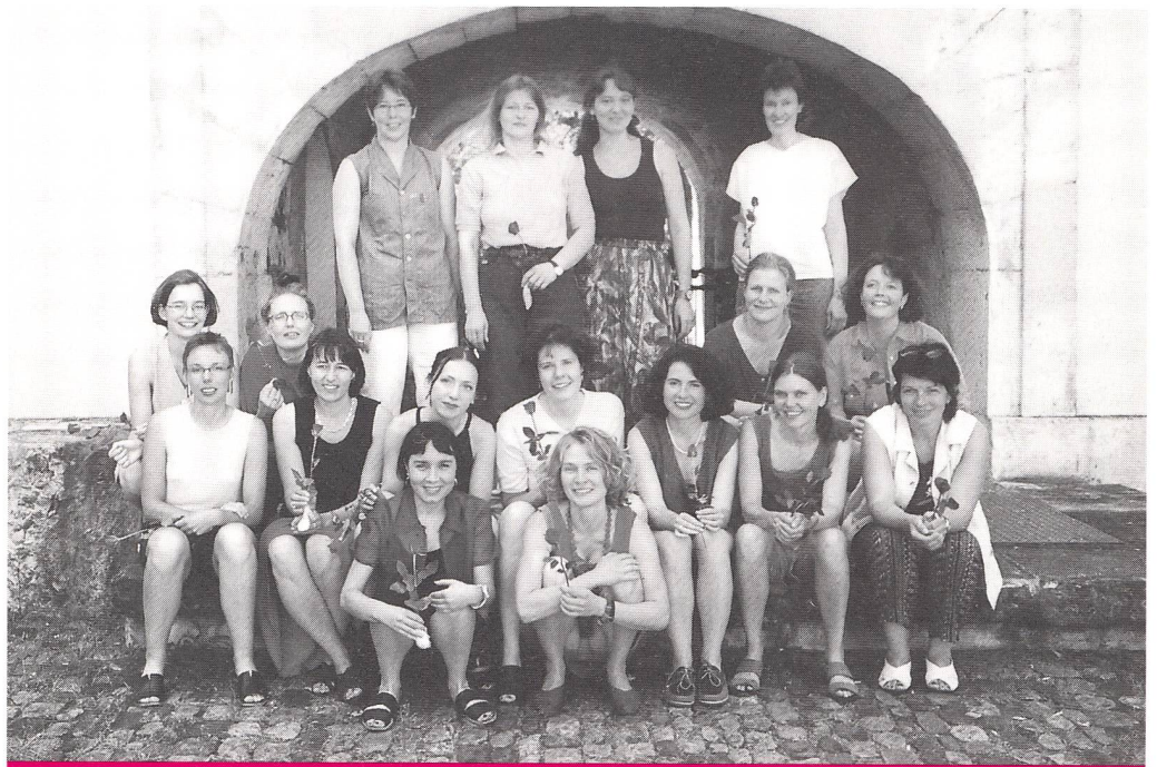
Die erfolgreichen Absolventinnen der HöFa I

«Starke Frauen sind normale Frauen!» Diese Aussage einer Kurskollegin haben wir für uns persönlich als Berufsmotto beim Abschluss der höheren Fachausbildung Stufe I für Hebammen mitgenommen. Die im September letzten Jahres begonnene Ausbildung an der Kaderschule für die Krankenpflege in Aarau ging im August zu Ende. Als Teilnehmerinnen mussten wir das Hebammen-diplom, zwei Jahre Berufserfahrung und mindestens eine Teilzeittätigkeit in der Geburtshilfe vorweisen können. Ziel dieser Ausbildung ist ein Kompetenzerwerb in den Bereichen Geburtshilfe, die eigene Person, Berufsrolle und Institution des Gesundheitswesens. Als Abschlusszertifikat erwarben wir einen Fähigkeitsausweis. Der Inhalt der Kurswochen präsentierte sich entsprechend dem Ziel sehr vielfältig und reichte von den Themen Menschenbild/Berufsbild über vertiefte hebamenspezifische Inhalte bis zu Soziologie und psychologischer Praxisbegleitung. In letzterer analysierten wir in