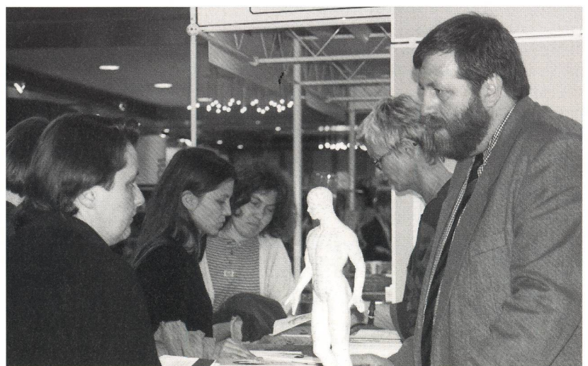
Comme toujours, les stands ont attiré un public attentif et avide de nouveautés.