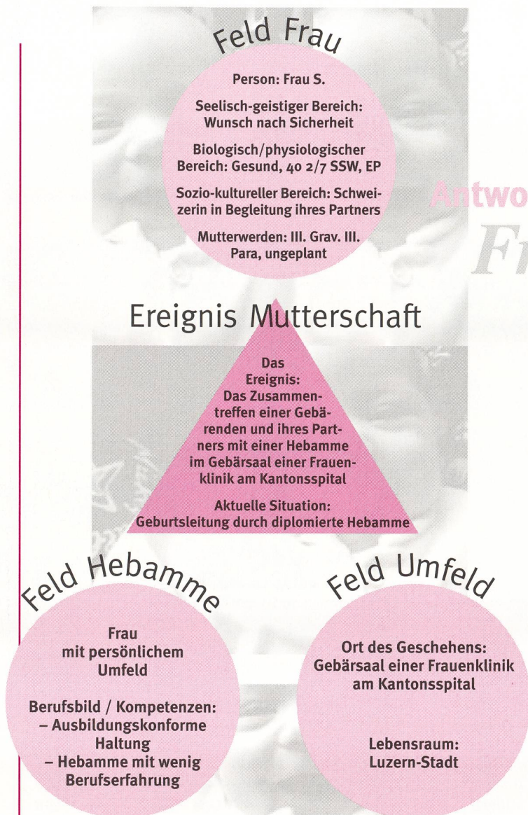
Abb. 2: Ereignis Mutterschaft, Bereich Geburt