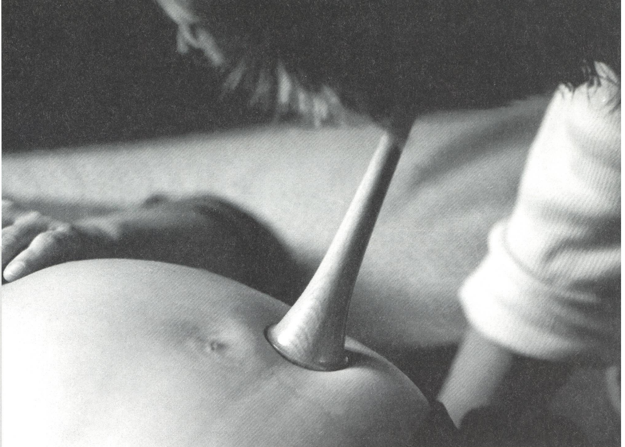
Auch bei der Begleitung der Schwangeren kommt die Kunst der Hebamme zum Tragen.