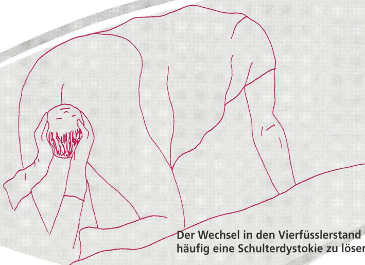
Der Wechsel in den Vierfüsslerstand vermag häufig eine Schulterdystokie zu lösen.