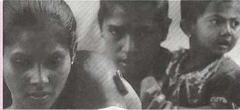
Rassismus betrifft uns alle

80 S., Fr. 35.–, erhältlich bei: Geburtshaus Villa Oberburg, Emmentalstr. 240, 3414 Oberburg, Tel. 034 429 11 11.