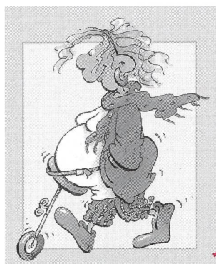
Cartoon: Barbara Hörnberg

Die Kunde von Osteopathie und Cranio- sacral-Therapie als wirkungsvolle kom- plementärmedizinische Therapien auch für Schwangere, Gebärende und ihre Neugeborenen dringt in letzter Zeit vermehrt an die Öffentlichkeit – nicht zuletzt auch dank dem zunehmenden Interesse der Publikumsmedien für die- se Heilmethoden. Besonders die Cra- niosacral-Therapie bietet Hebammen ein vielversprechendes Gebiet an, in dem sie sich zusätzlich professionell profilieren können.