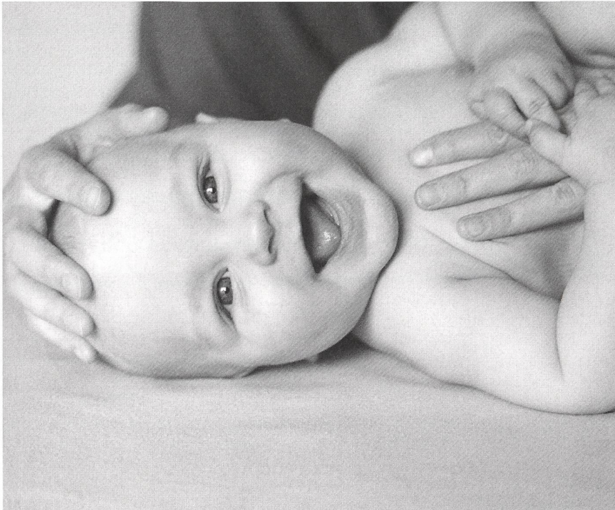
Die Craniosacrale Behandlung ist ganz offensichtlich ein Genuss!

deshalb mit einer Craniosacral-Therapeutin zusammen zu arbeiten. Ich schickte interessierte Frauen, welche ich bei einer schweren oder unnatürlichen Geburt begleitet hatte, mit ihren Babys zu ihr in Behandlung. Als teilweise freischaffende Hebamme mit ambulanter Wochenbettbetreuung begleite ich oft auch andere Mütter. So konnte ich bei spezifischen Problemen, denen weder Homöopathie noch Naturheilmittel halfen, durch Empfehlung der Craniosacral-Therapie schon sehr eindrückliche und schöne Entwicklungen zum Guten beobachten. Hier zwei Fallbeispiele, die ich als begleitende Hebamme erlebt habe.