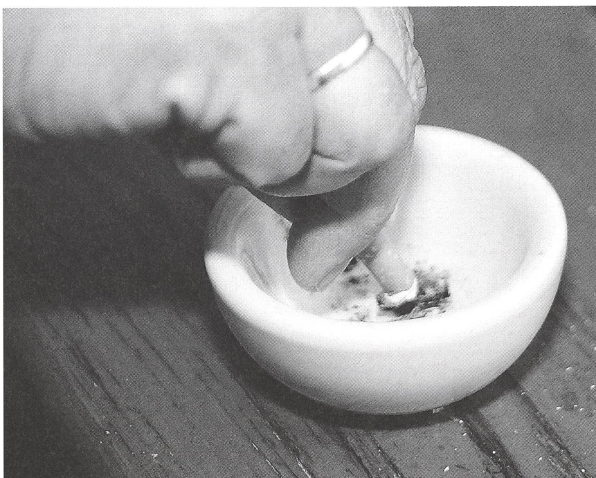
Auch reduziertes Rauchen hat positive Auswirkungen aufs Kind.

In der nicht-schwangeren Bevölkerung ist die Wirksamkeit einer Nikotin-Ersatztherapie, begleitet von minimaler Unterstützung, fest etabliert. Der Einsatz dieser Therapie bei schwangeren Frauen wird kontrovers beurteilt, haben doch Tierversuche ergeben, dass injiziertes Nikotin fötale Hypoxie, Früh- und Missbildungen hervor-