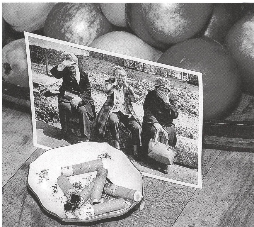
Spaziergang – oder Apfel – statt Zigarette.