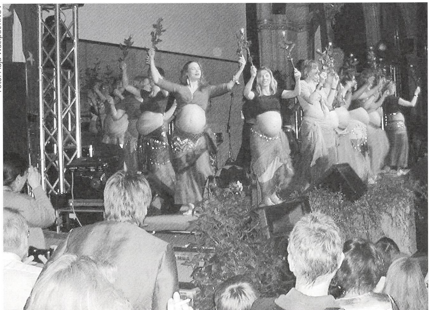
Hier flippten die Hebammen: Bauchtanz am Galaabend im Wiener Rathaus.