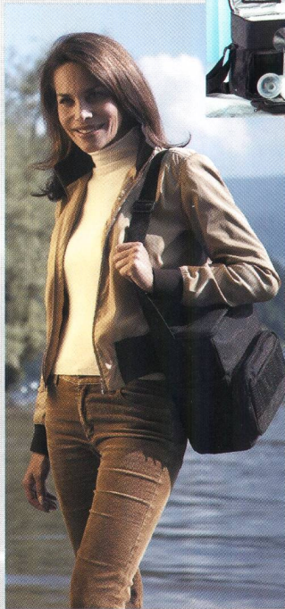
Alles dabei für unterwegs: Stillset «Mobil»