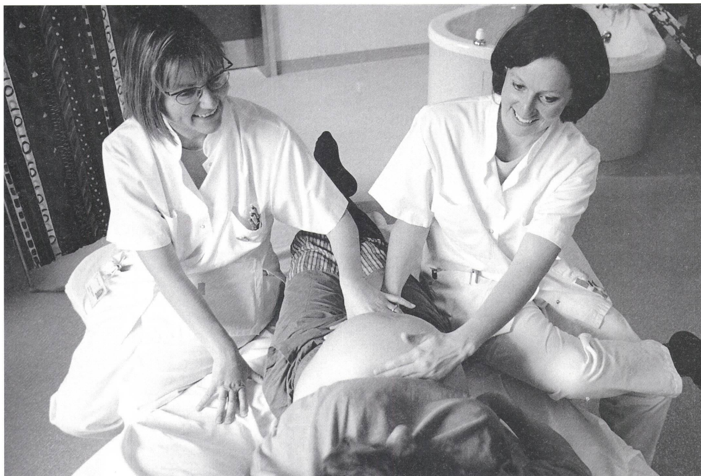
Wissenschaftliche Untersuchungen zeigen: Von Hebammen betreute Geburten haben weniger Interventionen zur Folge.