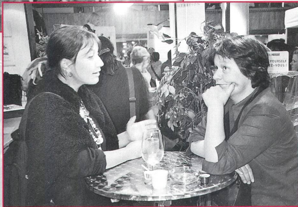
Ein Espresso bringt neuen Schwung!

te eine Frau ihren Partner als Gegner haben in ihren Entscheidungen, wird es für sie sehr schwierig sein, ihrem persönlichen Instinkt zu folgen. Also zuerst Gruppen für Paare!