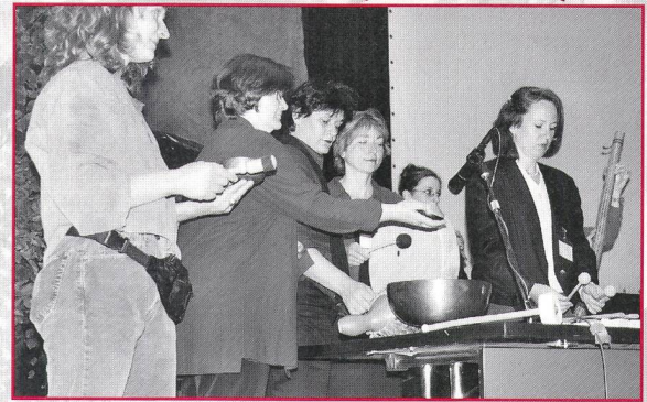
En pleine action lors de l'ouverture de la journée de formation.