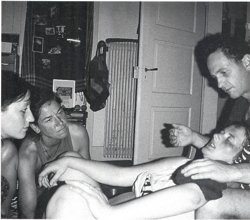
Zur Dokumentation der Hausgeburtshebamme gehören auch Notizen über Verhalten, Stimmung und Aktivitäten der Frau und der Familie.