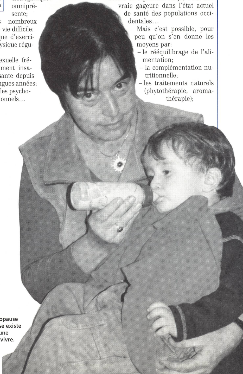
La ménopause heureuse existe et chacune peut la vivre.

La ménopause, délicate adaptation des régulations hormonales, demande un effort important à tout notre système glandulaire, et à l'hypophyse, qui en est le maître d'œuvre sous l'impulsion de l'hypothalamus, en particulier. Pas étonnant, dès lors, que certains bouleversements puissent se manifester, d'autant plus que tous les réajustements nécessaires se produisent alors que souvent