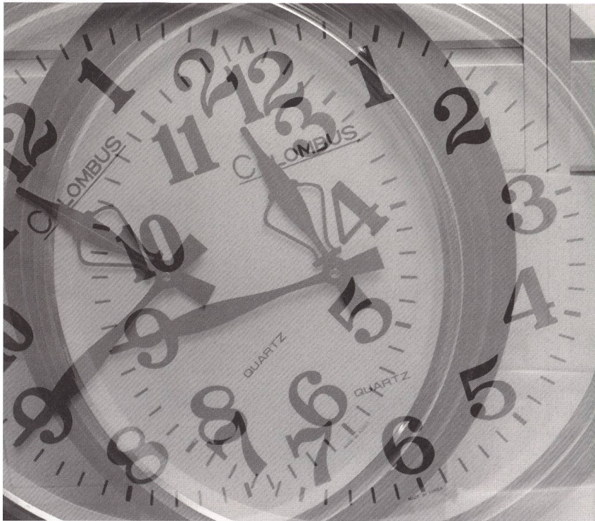
La date de la ménopause n'est pas facile à déterminer avec précision. Une période plus ou moins longue d'irrégularités menstruelles peut précéder l'arrêt définitif des règles.