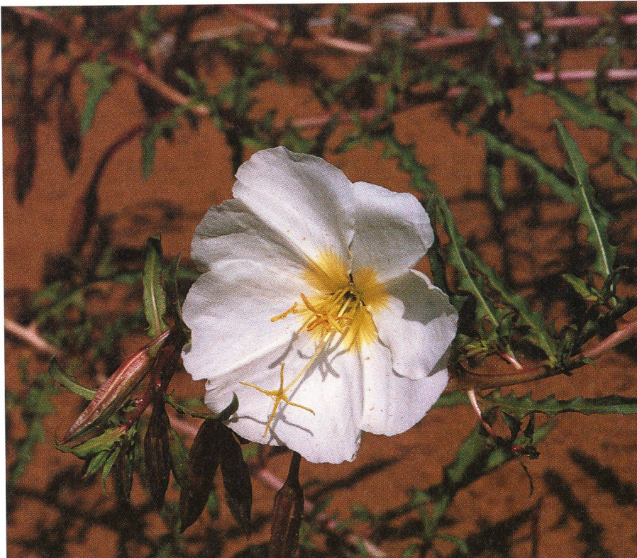
Nachtkerze ( Oenothera spec. , weissblühend, USA). Ihre Wirkstoffe sind Triglyceride mit verschiedenen Säuren. Gute Wirkung wird bei Juckreiz, Hautrötungen und -entzündungen erzielt, das Nachtkerzenöl enthält mehrfach ungesättigte Fettsäuren.

Nein, tut es nicht! Wenn Wehen nach Genuss dieses Tees eintreten, dann wegen den ätherischen Ölen, die im besten Fall (d. h., wenn der Tee beim Ziehen zugedeckt wurde) aus Gewürznelken und Zimt in den Tee übergegangen sind. Das Wohlriechende Eisenkraut , bekannt als Verveine (verbena odorata) oder «Zitronenstrauch»), gilt als Genusstee oder bestenfalls magenstärkend. Dieser Eisenkrauttee wird in Portionenbeuteln z. B. von Sidroga in Drogerien verkauft. – Den Uterus tonisiert das Iridoid «Verbena- lin», welches im «anderen» Eisenkraut (verbena officinalis) enthalten ist. Leider schmeckt der Tee aus diesem Eisenkraut überhaupt nicht «wohl», aber er wirkt! – Gute Drogerien bestellen für Hebammen dieses Kraut beim Grossisten Hänssler in Herisau.