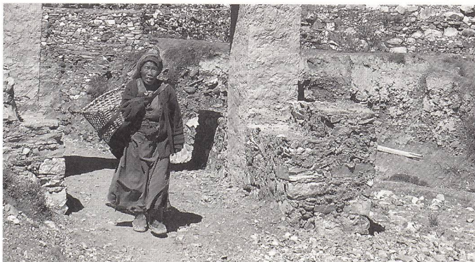
Egal ob hochschwanger oder gleich nach der Niederkunft: Eine Bäuerin auf dem Weg zur Feldarbeit.

In Kursen lernen Männer und Frauen, die Gründe für einen Uterusvorfall zu erkennen: Fehl- und Mangelernährung, der unhygienische Viehstall als Wochenbett, kurze Abstände zwischen den Schwangerschaften, vor allem aber die harte Arbeit und das Tragen schwerer Lasten auch hochschwanger und unmittelbar nach der Geburt.