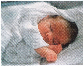
Palmarès des prénoms 2004