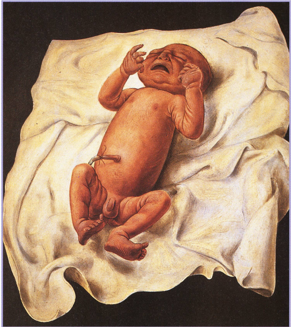
Otto Dix, «Neugeborenes mit Nabelschnur auf Tuch (Ursus)», 1927, Mischtechnik auf Holz 60 x 50 cm.