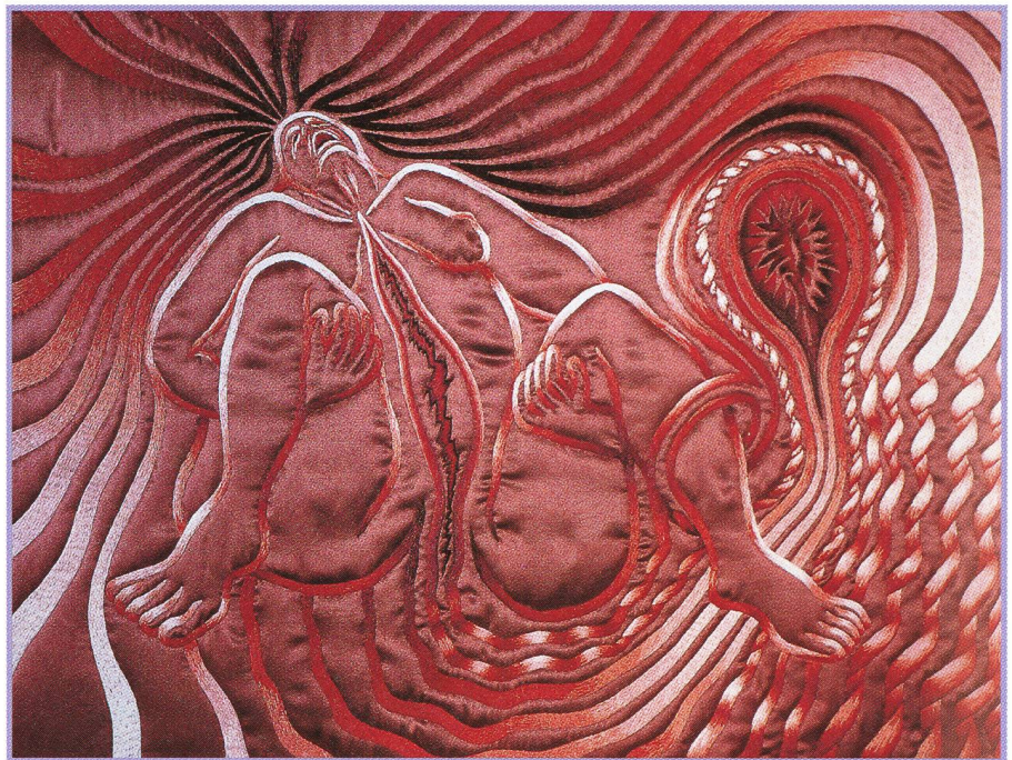
Judy Chicago , «Birth tear/Tear» (Birth Project), 1982, Stickerei.