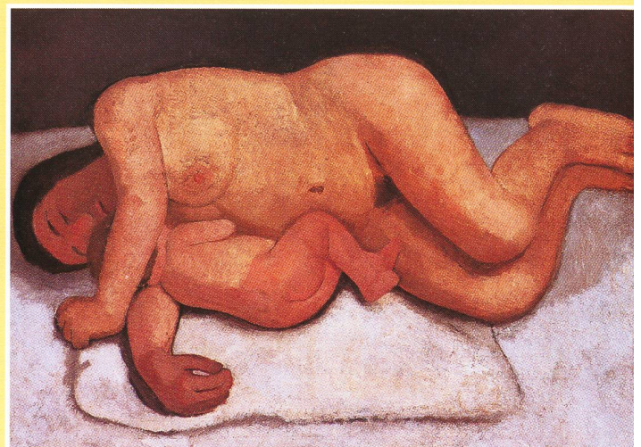
Paula Modersohn-Becker , «Liegende Mutter mit Kind», 1906, 77 x 122 cm

malt und auf wenige warme Farben konzentriert, heben sich die beiden Körper als ein einheitliches Ganzes gegen den schlichten Hintergrund ab. Die Auffassung von der Frau als der Spenderin und Beschützerin des Lebens und Paulas Glaube an die «Mutterbotschaft»