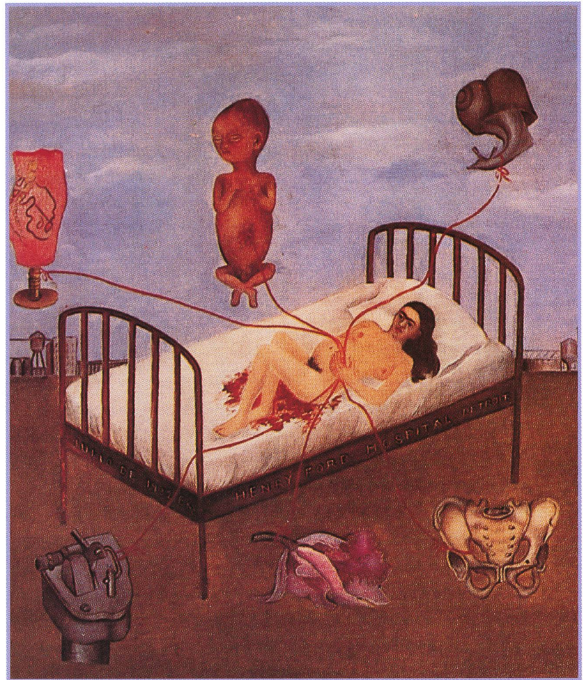
Frida Kahlo, «Henry Ford Hospital», 1932.

Vorlage waren medizinische Lehrbücher. Dargestellt hat sie den Moment, als sie selbst von ihrer Mutter geboren wurde. Das Bild heisst «Meine Geburt». So naturalistisch hatten es bisher weder Kubin, Dix oder Hannah Höch gemalt. Neben der naturalistischen Darstellung der Geburt ist das Bild jedoch surrealistisch, wie etwa die Verhüllung des mütterlichen Kopfes. Zu bedeuten hatte dies, dass Frida Kahlos Mutter während dem Entstehen des Bildes verstarb. Kahlo war beeinflusst von den Surrealisten, von präkolumbianischen Skulpturen, der Votivmalerei und der mexikanischen Volkskunst. Ihre Bilder waren zunächst nur für sie selbst bestimmt. Auch aus dem Grund waren sie so intim wie Tagebuchaufzeichnungen. Indem sie als erste Frau weibliche kör-