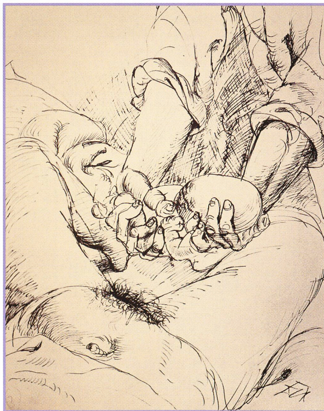
Otto Dix, «Geburt 3», 1928, Tusche, Feder 45,2 x 38,2 cm.