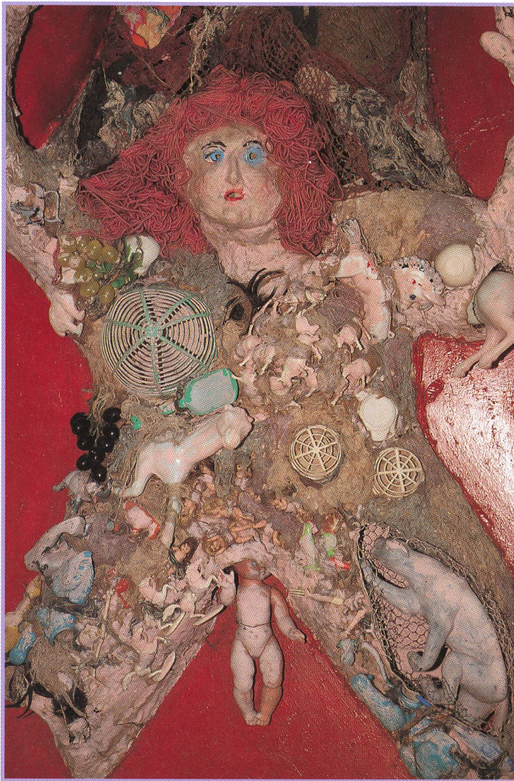
Niki de Saint Phalle , «Autel des Femmes» (Ausschnitt), 1963, Collage.

te Collagen und Assemblagen aus Abfall und Plastikspielzeug. Deren Ästhetik war eine morbide Vergänglichkeit. Die Farben waren schmutzig. «Meine Vorstellung von Geburt ist eine männlich starke Frau im Akt des Gebärens. Sie ist eine Göttin.»