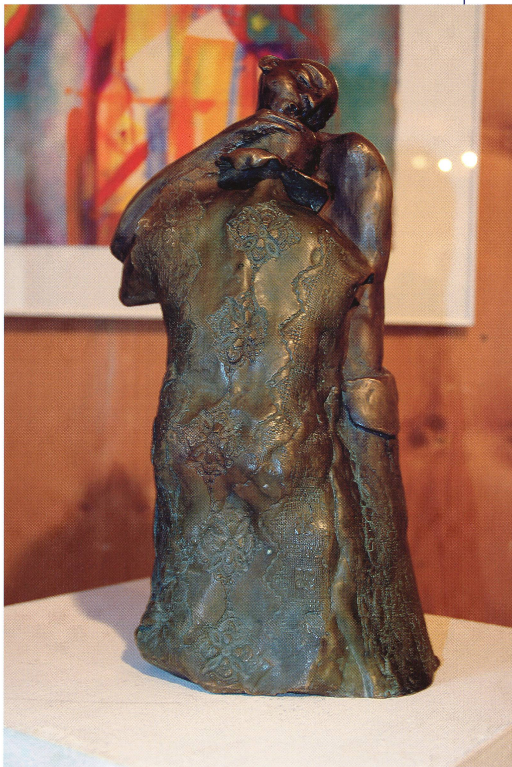
Couple, bronze, René Vasquez.

J'ai beaucoup travaillé le thème du taureau dans l'arène. C'est une métaphore de la condition humaine. Le taureau passe brutalement d'un lieu obscur et confiné à la lumière – crue,