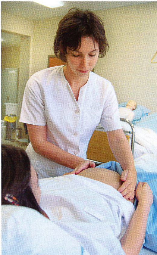
L'environnement social est aussi un élément à ne pas négliger.

Les données fournies notamment par les US médicaux et transmises par la femme enceinte sont superposées aux réponses que me fournit la palpation pratiquée et permettent: