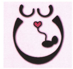
Doulas danoises (Dansk doulas)

recherche d'avoir recours à une doula sont diverses, les effets non prévus au départ sont également importants et relativement nombreux. Empowerment (dans le sens le plus large de ce terme), conseillère, rassurance, validation, présence continue, accompagnatrice, porte-parole, respect, compréhension, écoute, relaxation sont les mots clés à la base de ces raisons.