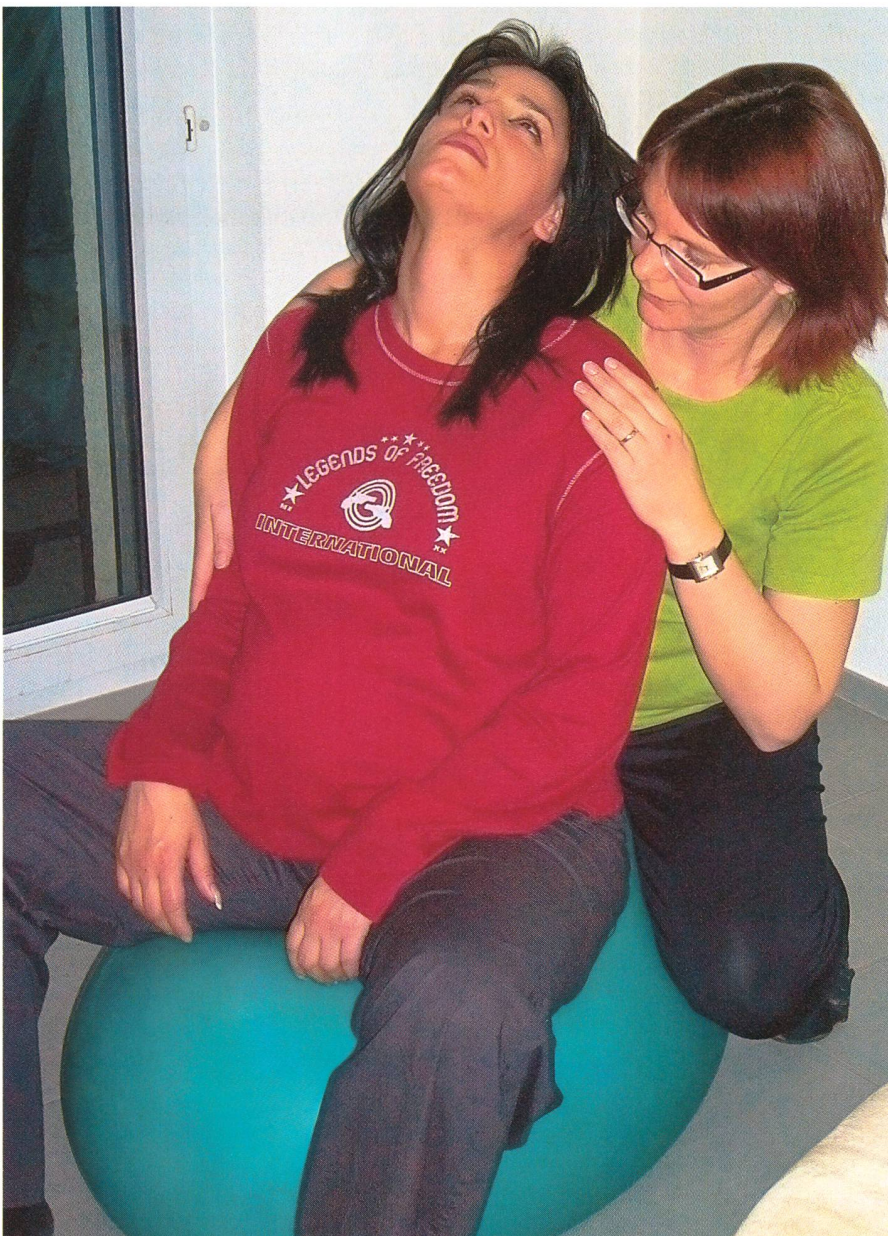
«J'avais l'impression qu'une femme qui a eu des grossesses et naissances elle-même comprend mieux», dit une mère qui a eu recours à une doula.

Si les raisons évoquées par les femmes rencontrées au cours de cette