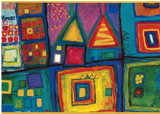
Foyeux Noël · Frohe Weihnachten · Buon Natale

Unseren Leserinnen und Lesern wünschen wir von Herzen eine friedliche Weihnachtszeit und einen guten Jahresbeginn.