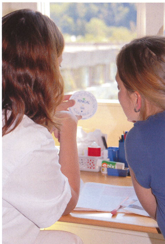
Stress beim Warten auf ein Testresultat kommt kaum je zur Sprache.