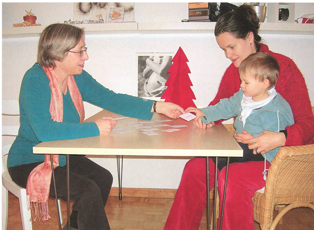
In der dialogischen Beratung gilt es zu erspüren, wie die Frau auf ihrem Weg begleitet sein möchte.

Die Expertenberatung steht hier im Vordergrund. Von 100 Frauen lassen 27 den Arzt entscheiden, ob ein Test durchgeführt werden soll, und von 100 Paaren lassen 14 den Arzt mitentscheiden. Die Beratung geht aber auch Richtung dialogische Beratung: immerhin 45 Frauen von 100 entscheiden selber über die Durchführung der Tests. Ob die Frauen schon aufgeklärt in die Praxis kommen, ist leider durch meine Fragestellung nicht ersichtlich. Bei den Frauen über 35 ist nicht ganz klar, ob