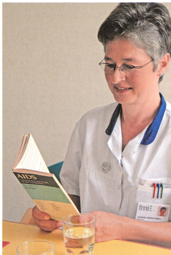
Die Vernetzung mit spezialisierten Beratungsstellen ist für die Praxis wichtig.

Wichtig wäre es, dass eine junge Frau sich vor einer Schwangerschaft Gedanken über Pränataldiagnostik und ihre Folgen macht. Ich bin erstaunt, wie unkritisch die jungen Frauen in Bezug auf die Themen Schwangerschaft und Pränataldiagnostik eingestellt sind. Auch der Zusammenhang von Pränataldiagnostik und Genforschung wird nicht wahrgenommen. Dass die In-vitro-Fertilisation Tür und Tor öffnete, um an menschlichem Erbgut herum zu experimentieren, wissen die jungen Leute kaum.